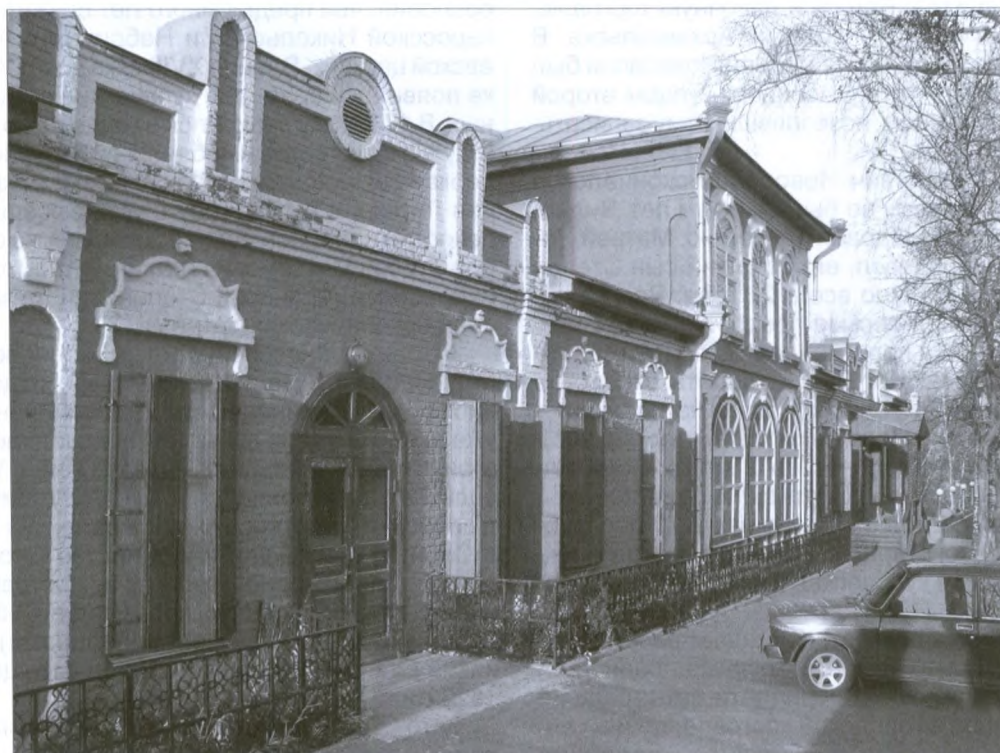
Национальный музей РК (бывший магазин Дербеневых)