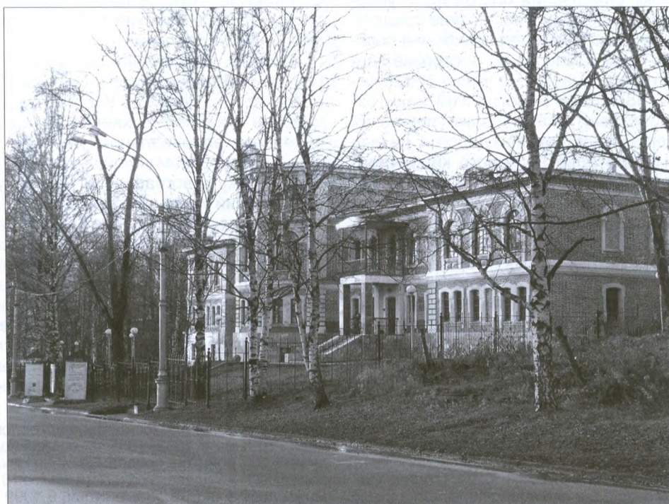
Национальная галерея РК (бывшее здание духовного училища)