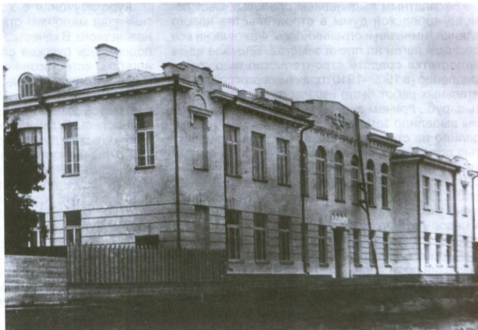
Александринская женская гимназия. Начало XX века

ко-крестьянской – дети из семей этих сословий составляли более 70% учениц. Надо иметь в виду, что около 15% учениц из малоимущих семей освобождались от платы за обучение, а еще около 20 учениц получали различные стипендии (в основном от земства), позволявшие не только оплатить обучение, но и, пусть и небогато, жить в городе во время учебы. Городское общество и земство оказывали и другую посильную помощь малоимущим воспитанницам. Еще в 1902 году было образовано Общество вспомоществования нуждающимся учащимся, при гимназии было общежитие (правда, в первые годы не очень комфортное, в частном доме, зато до 1914 года бесплатное), где за минималь-