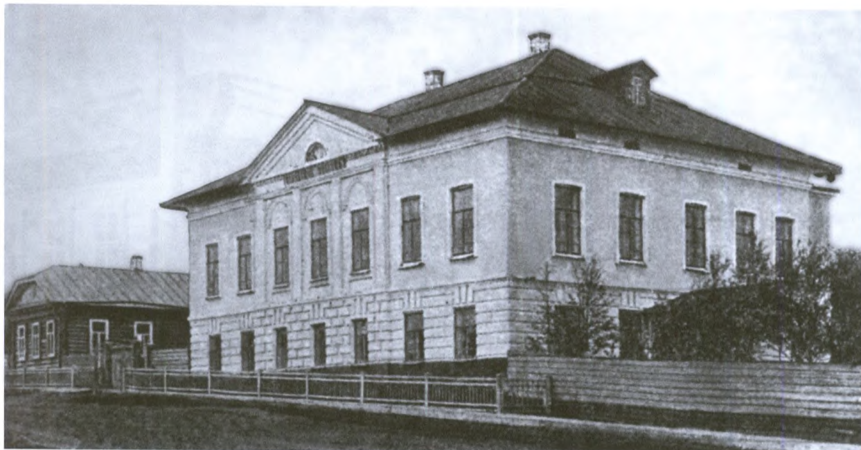
Уездное (позднее – городское, высшее начальное) училище (дом Суханова). Начало XX века

ховных училищ», Высочайше утвержденных в 1808 году. В приходских духовных училищах обучались мальчики из семей духовенства, готовящиеся к поступлению в уездные духовные училища (ближайшие из них находились в Яренске и Сольвычегодске). Принимали в приходские училища в 7–8 лет, и обучение длилось два года.