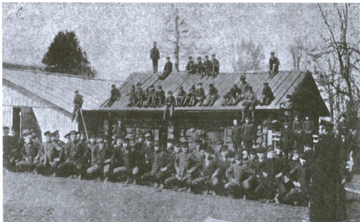
Занятия гимнастикой в городском училище

ным), но в начале 80-х годов оно вынуждено было перебраться на второй этаж «наемного дома», пока на городские средства для него не было выстроено деревянное одноэтажное здание на каменном фундаменте на Набережной улице (11 квартал, плановые места № 179, 180), где училище благополучно дожило до 1917 года. Этот небольшой дом вполне удовлетворял бы потребности училища, если бы в нем, как и раньше, обучалось 40–50 учеников. Но училище, оставаясь одноклассным, стало трехгодичным. Соответственно и число учеников стало быстро расти. В 1875 году их было 63, в 1886 – 78, в 1905 – 126 и в 1910 – 131. Один учитель «общих предметов» с таким количеством учащихся справиться не мог. На помощь пришло земство. В 1874 году оно, учитывая, что «при подобной многочисленности учащихся, в добавок поступающих в школу, в большинстве совершенно не зная русской речи, физически невозможно одному учителю вести обучение надлежащим образом, и притом еще за столь скудное вознаграждение», приняло решение увеличить зарплату законоучителю и учителю, а также нанять второго учителя (пришлось и городской думе выделить средства на жалованье второго учителя) [25].