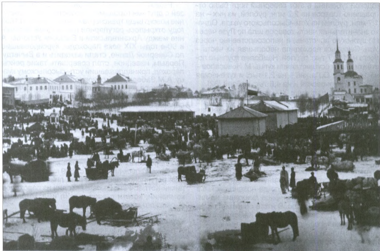
Георгиевская ярмарка. Начало XX века

привозную с реки Печоры соленую бочками семгу, сига, щуку и язей и кедровые орехи и все оное покупают по сходственной же неравной же цене, а частью меняют на потребные для города товары. Крестьяне из уезда привозят к торгу разные свои избытки и промыслы: вышеизъявленных зверей, диких гусей, уток, лебедей, журавлей, тетеревов, рябков, свежую рыбу, говяжье мясо, хлеб, рожь, ячмень, овес и конопля и льняное семя, хмель, масло, сало коровье, кожи сыромятные и барани деланные, кои скупают того города жители для своего расхода» [34].