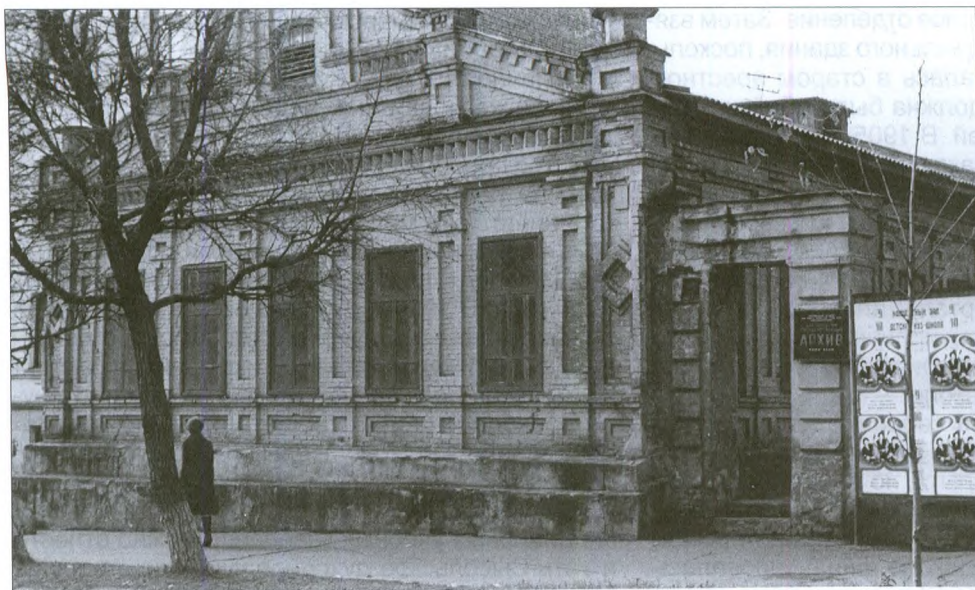
Ремесленная школа. Современный вид