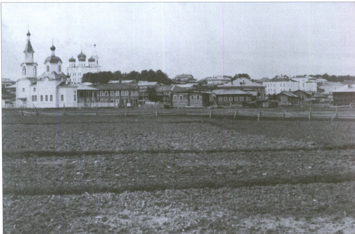
Огороды за городской окраиной. Вдали – Богородицкая тюремная церковь

щее большинство платили 1–2 рубля). К концу XIX века состав принадлежащей городу земли почти не изменился. В 1890 году 8150 десятин 394 сажени составляли «лесные дачи» (как видим, с конца XVIII века лесные массивы существенно уменьшились) и 6384 десятины 640 сажений – выгонная земля, из которой 522 десятины 770 сажений находились «под скотскими выгонами», а 4082 десятины сдавались в аренду под пашню, сенокосы, заводы и мельницы.