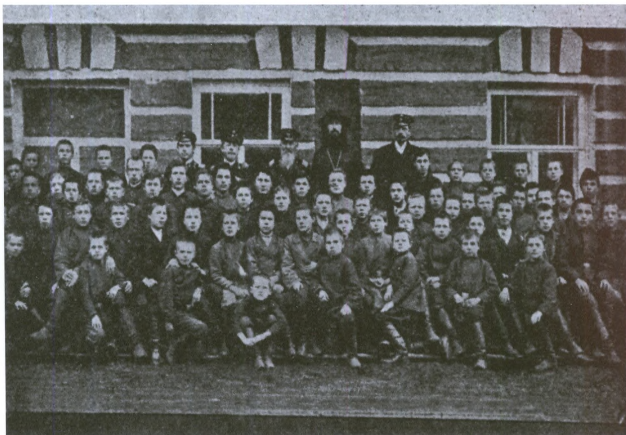
Преподаватели и ученики городского училища. 1902 г.

Общую сумму назвать сложно, поскольку в земском бюджете расходы на финансирование городских школ отдельной строкой не выделялись (основные расходы шли на содержание земских школ в уезде, число которых возросло с 16 в 1884 до 113 в 1914 году). Но, как мы увидим, пособия от земства получали все усть-сысольские школы, вне зависимости от того, были ли они городскими или казенными. Причем эти пособия всегда были больше, чем средства, выделяемые из городского бюджета (если, конечно, они вообще выделялись, поскольку город финансировал далеко не все усть-сысольские учебные заведения).