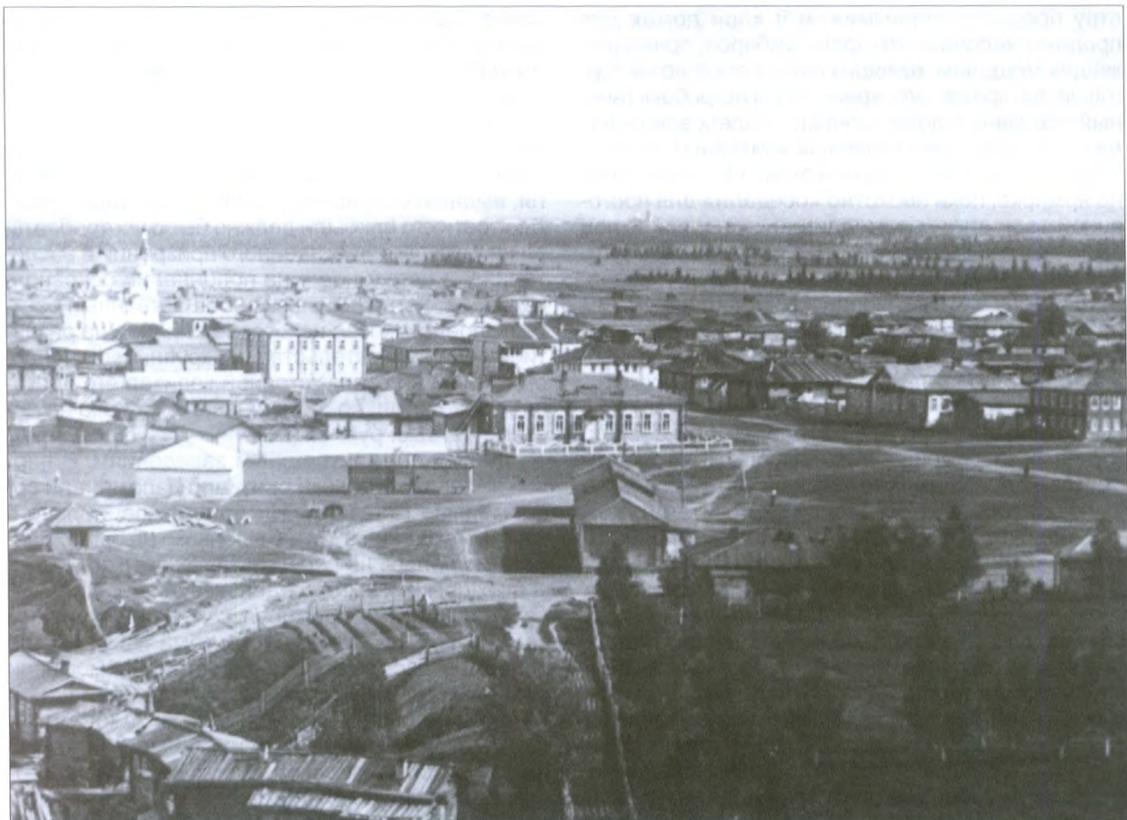
Базарная площадь и Народный дом