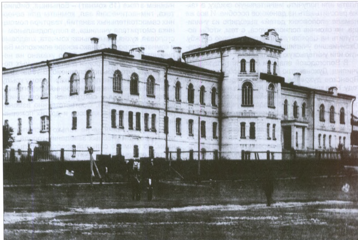
Духовное училище. Начало XX века