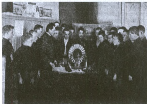
Урок физики в городском училище. 1909 г.

В 70-е годы XIX века училище помещалось в «общественном деревянном доме, довольно холодном» (возможно, построенным М.Н.Латки-