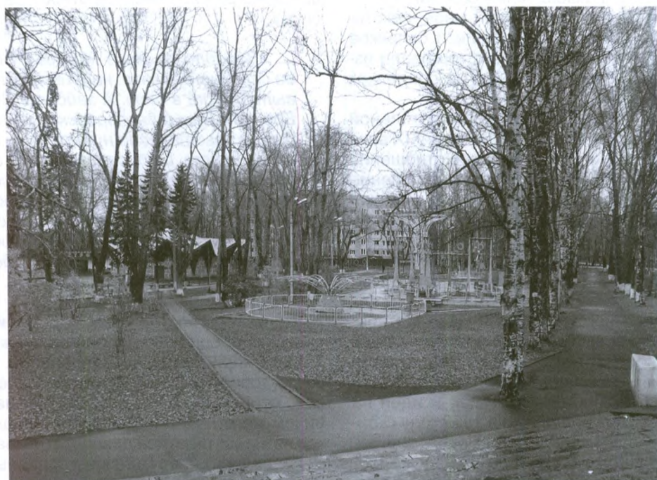
Парк им. С.М.Кирова. Сто лет назад здесь была базарная площадь