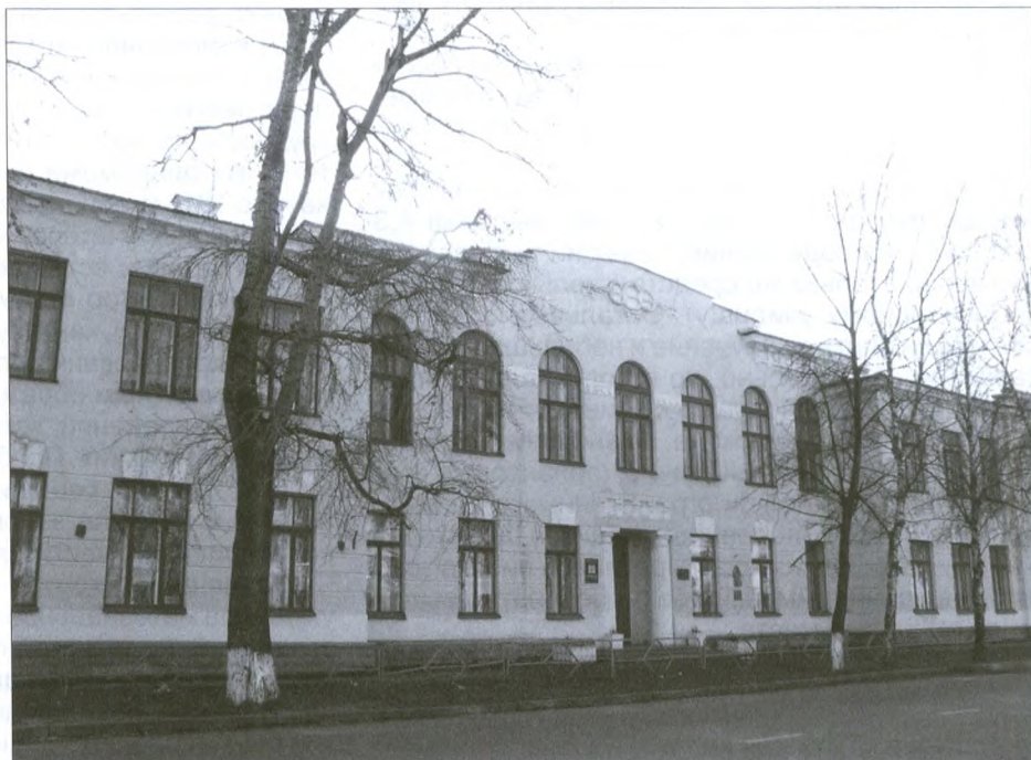
Гимназия им. А.С.Пушкина (бывшая Александринская женская гимназия)