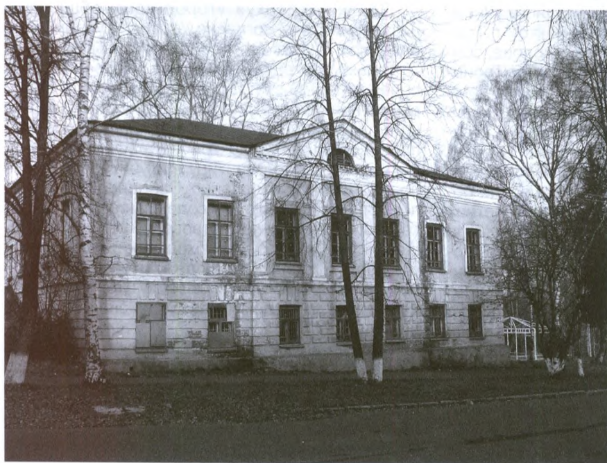
Национальный музей РК (дом Суханова)

Считается, что училище было открыто в 1822 году. С этого года у него появился штатный смотритель – Александр Шергин, переведенный на эту должность из Сольвычегодского уездного духовного училища (с 1825 года – протоиерей Троицкого собора) [6]. Но в официальных статистических справочниках 1825 и 1833 годов наличие школ в Усть-Сысольске не отмечено, вероятно, потому, что училище числилось по духовному ведомству. Не исключено, что училище начало действовать даже раньше указанного года, поскольку уже в первой половине 20-х годов XIX века некоторые обучавшиеся в нем успели закончить