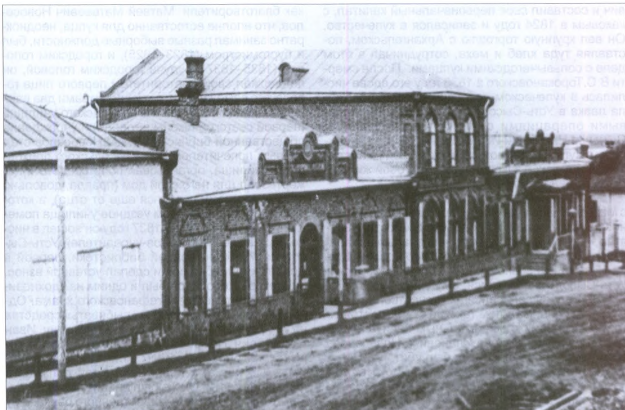
Магазин Дербеневых. Начало XX века