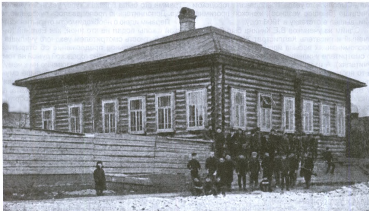
Первый класс городского училища

корни в усть-сысольскую почву, не приходится. В 1864 году среди горожан насчитывалось 59 «лиц, окончивших курс высших и средних учебных заведений» (из них 51 мужчина), 91 – «окончивших курс в уездном училище» и 2646 неграмотных [22].